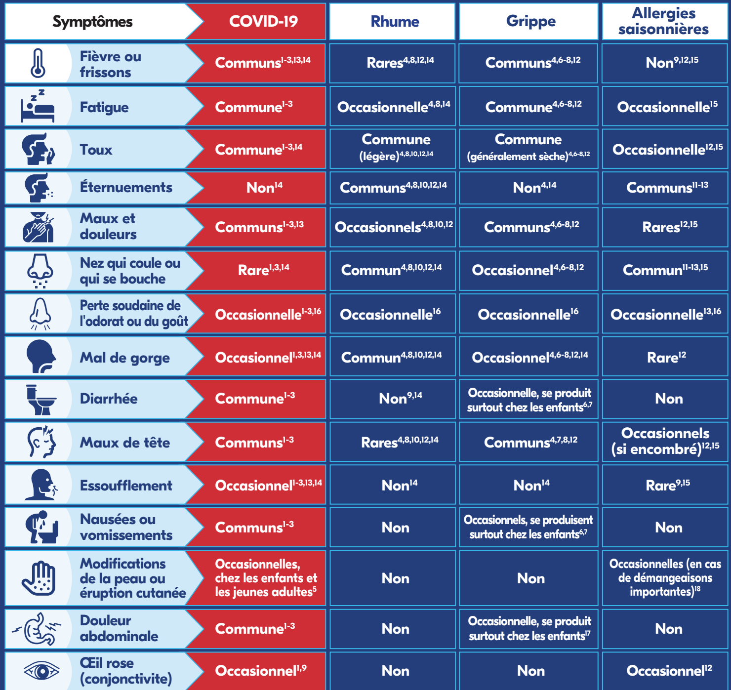
TABLEAU COMPARATIF : COVID-19, RHUME, GRIPPE, ALLERGIES